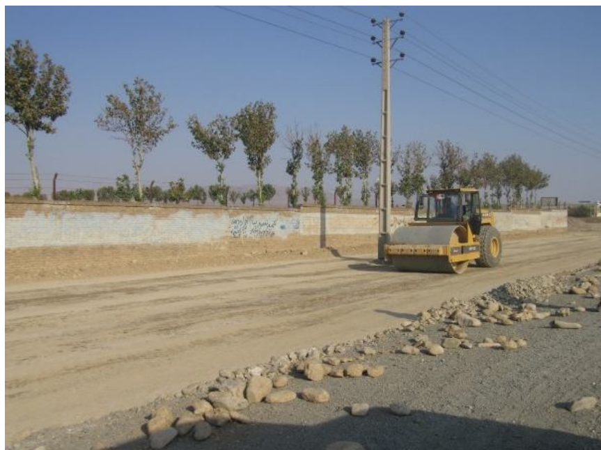
عکس 2: نمایی از اجرای زیراساس