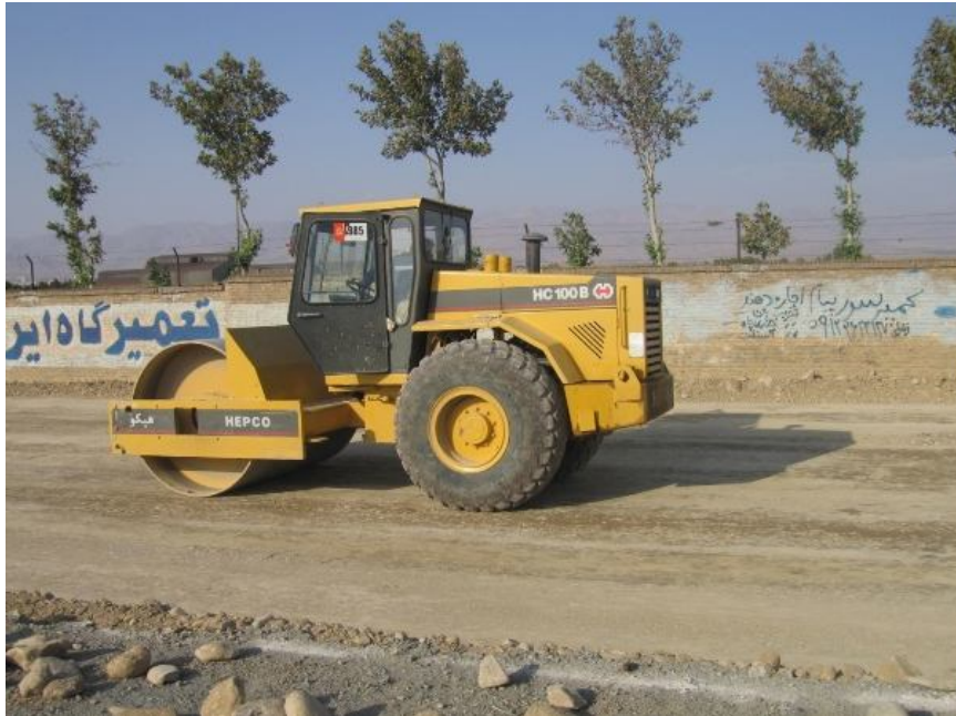
عکس 1: نمایی از اجرای زیر اساس