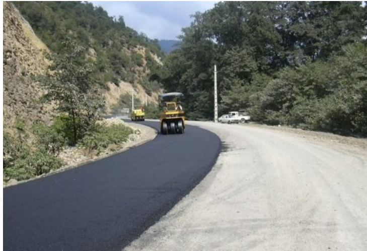
عکس 8: نمایی از اجرای آسفالت بیندر