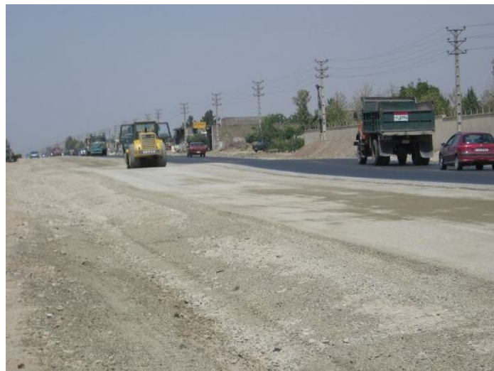
عکس ۵: نمایی از اجرای اساس