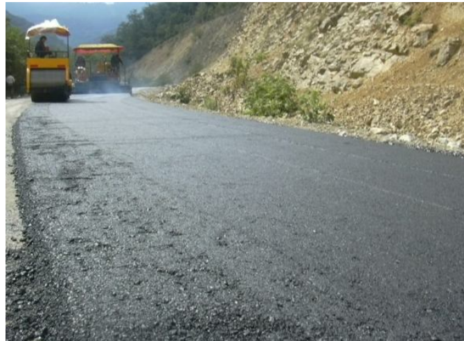
عکس 9: نمایی از اجرای آسفالت بیندر