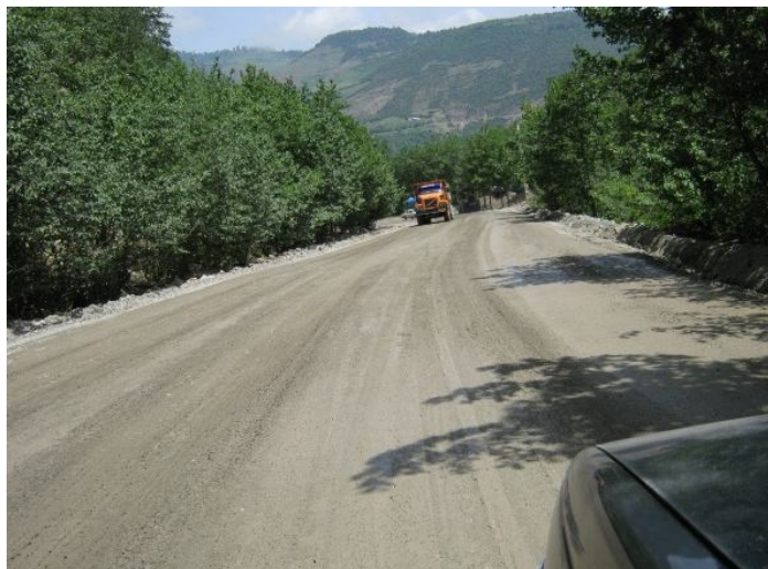
عکس ۷: نمایی از اجرای اساس