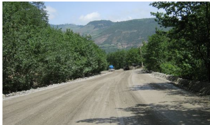
عکس ۶: نمایی از اجرای اساس