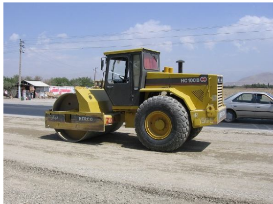
عکس ۳: نمایی از اجرای اساس

پ: به ازای هر 1000 متر مکعب مصالح ریزدانه مصرفی یکبار آزمایش دانه‌بندی، حدود روانی و خمیری و ارزش ماسه‌ای انجام شود.