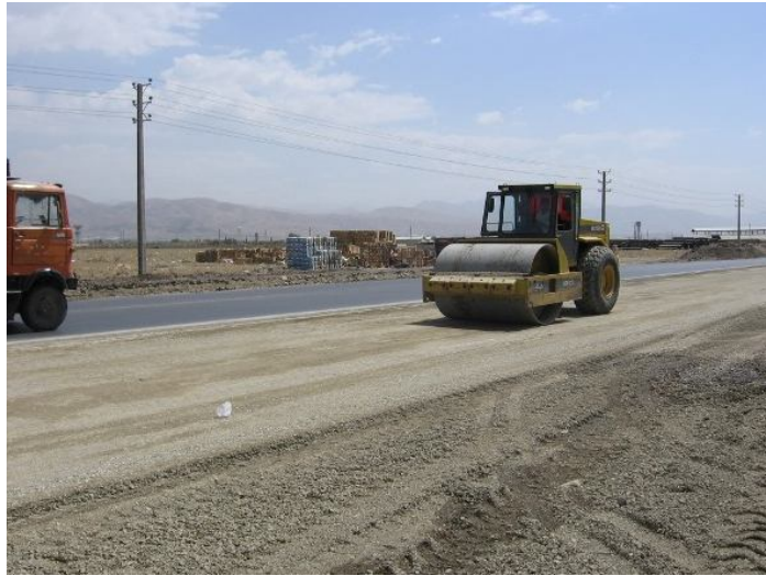
عکس ۴: نمایی از اجرای اساس