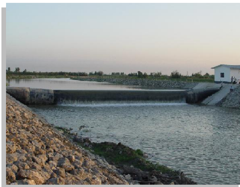
شکل (۱): تصویر سرریز آب از روی سد لاستیکی عرب خیل

در شکل (۱) تصویری از سد عرب خیل در فصل پر آبی مشاهده می‌شود که آب بالا دست در حال سرریز از روی سد می‌باشد.