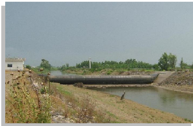
شکل (۳): تصویر سد لاستیکی عرب خیل در فصل کم آبی

در شکل (۳) تصویری از سد لاستیکی عرب خیل در فصل کم آبی مشاهده می شود که در قسمت بالا دست به علت خشک شدن رودخانه بتن پی سد هم قابل مشاهده است، اما آبی که در پایین دست سد مشاهده می شود در واقع آب شور دریای است. در هنگام کم آبی سطح تراز آب دریا بالاتر از سطح تراز آب شیرین رودخانه قرار می گیرد و این امر می تواند سبب شور شدن اراضی کشاورزی منطقه شود.