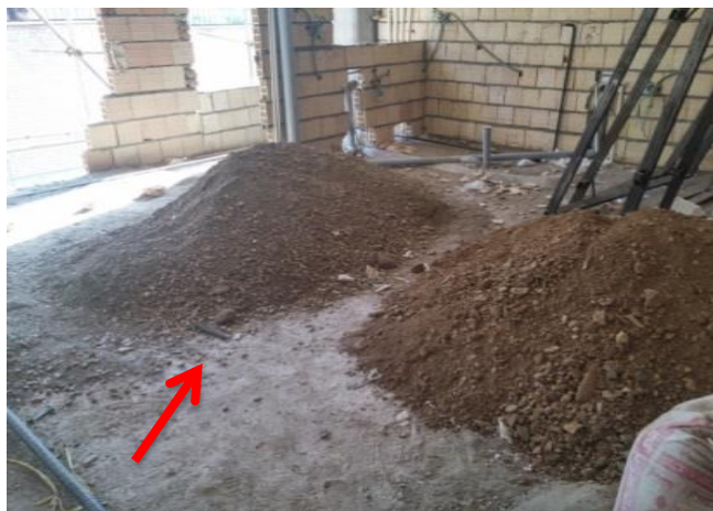
شکل ۲۰. استفاده غیر مجاز از خاک مخلوط در کفسازی طبقات و بام