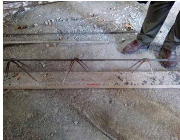
شکل ۱۳. فاصله زیاد آرماتور برشی در شکل سمت راست و خیز نامتعارف تیرچه فوندوله ای در تصویر سمت چپ