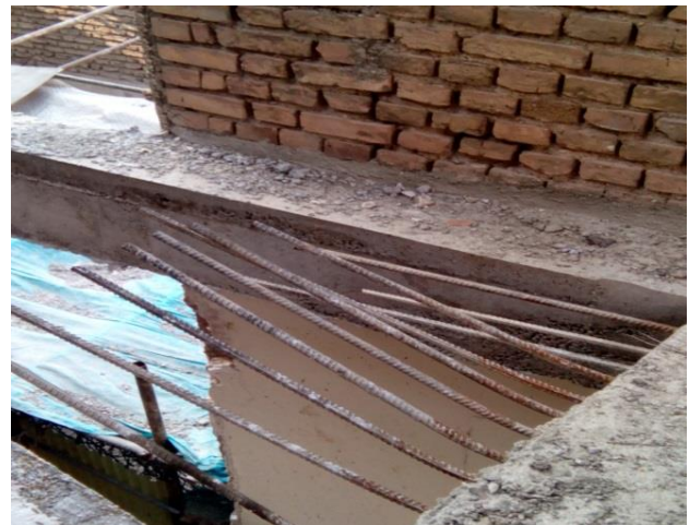
شکل ۸. اجرای آرماتوربندی دال راه پله به صورت شبکه تک لایه