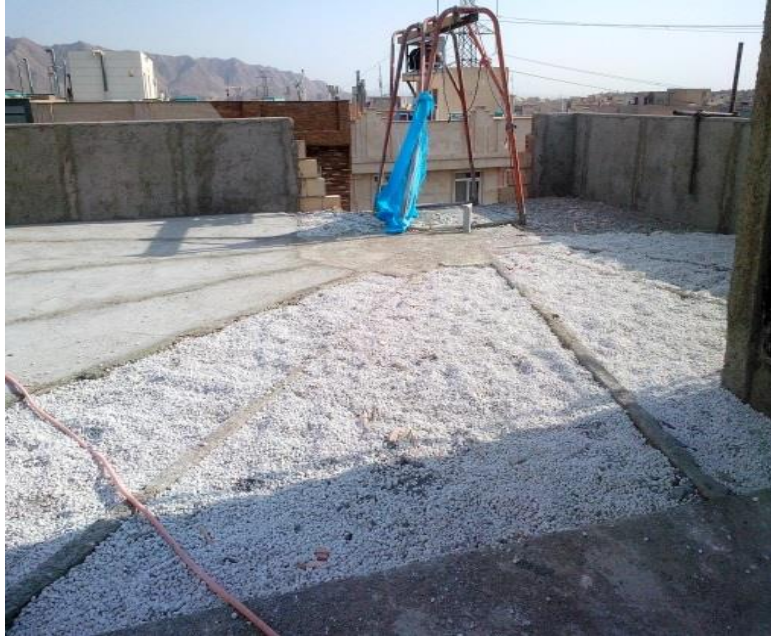
شکل ۲۱. استفاده از مصالح سبک در کفسازی بام.