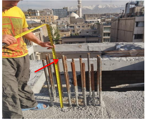
شکل ۲. کوتاه بودن طول وصله پوششی میلگردهای ستون