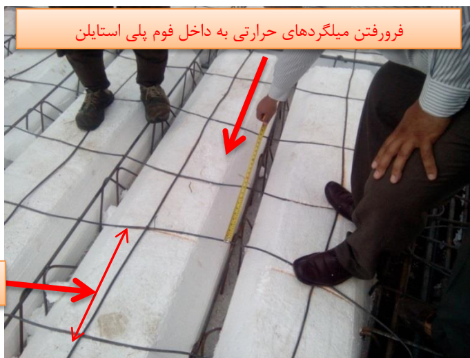
شکل ۱۸. عدم رعایت مشخصات آرماتور حرارتی

➤ در سقف های تیرچه بلوک ، تامین آرماتور افت و حرارت در دال رویه در هر دو جهت موازی و عمود بر تیرچه ها ضروری است . چنانچه میلگرد فوقانی در دال رویه قرار گیرد می توان آن را بخشی از فولاد حرارتی موازی با تیرچه لحاظ نمود. در هر صورت در موازات تیرچه تامین حداقل یک آرماتور بر روی بلوک ها ضرورت دارد. همچنین در حین بتن ریزی سقف لازم است که آرماتورهای حرارتی به بالا کشیده شود و از روی سطح بلوک ها فاصله گیرند.